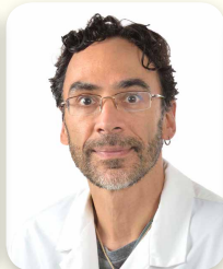
Chef du département d'Anesthésiologie Chief of the Department of Anesthesiology