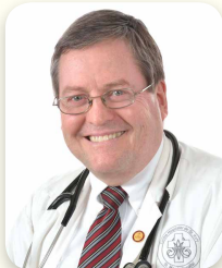
Chef du département de Médecine Spécialisée Chief of the Department of Specialized Medicine