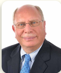
Chef du département d'Oncologie Chief of the Department of Oncology