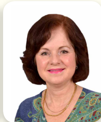
Chef du département de Biologie Médicale Biochimie, Hématologie, Microbiologie, Pathologie Chief of the Medical Biology Department Biochemistry, Hematology, Microbiology, Pathology