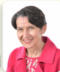
Chef du département de Chirurgie Chief of the Department of Surgery

St. Mary's very own "Group of Seven" is painting the Montreal healthcare landscape by bringing their outstanding academic and clinical tributes to their newly appointed positions of Medical Department Chiefs across our network of the CIUSSS ODIM (Centre intégré universitaire de santé et de services sociaux de l'Ouest de l'Île de Montréal). Recognized for their exceptional commitment to best practices, these St. Mary's leaders are establishing the benchmark for healthcare as it should be... ensuring that the highest standards for which we are known continue to be met today and tomorrow.