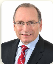
Chef du département d'Obstétrique et Gynécologie Chief of the Department of Obstetrics and Gynecology